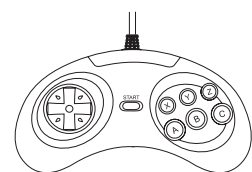
Joystick 6 botões