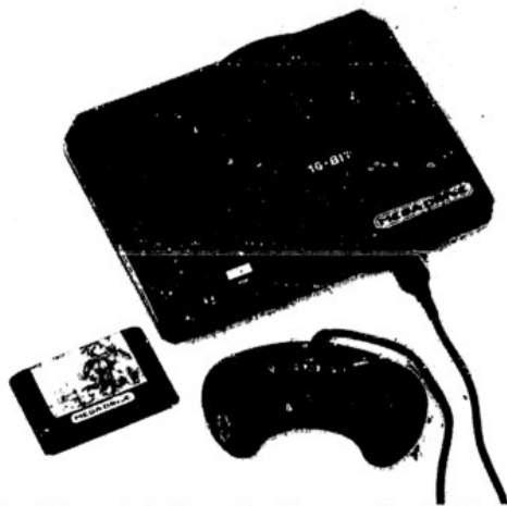
Console, 'joystick' e cartucho do videogame Mega Drive, que será lançado pela Tec Toy em dezembro